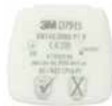
D7915 P1 R