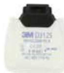
D3125 P2 R