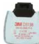
D3138 P3 R / Nepříjemné organické zápachy a kyselý plyny