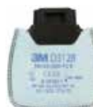
D3128 P2 R / Nepříjemné organické zápachy a kyselý plyny