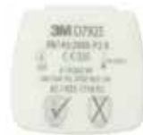
D7925 P2 R