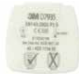
D7935 P3 R