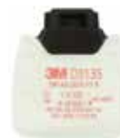
D3135 P3 R